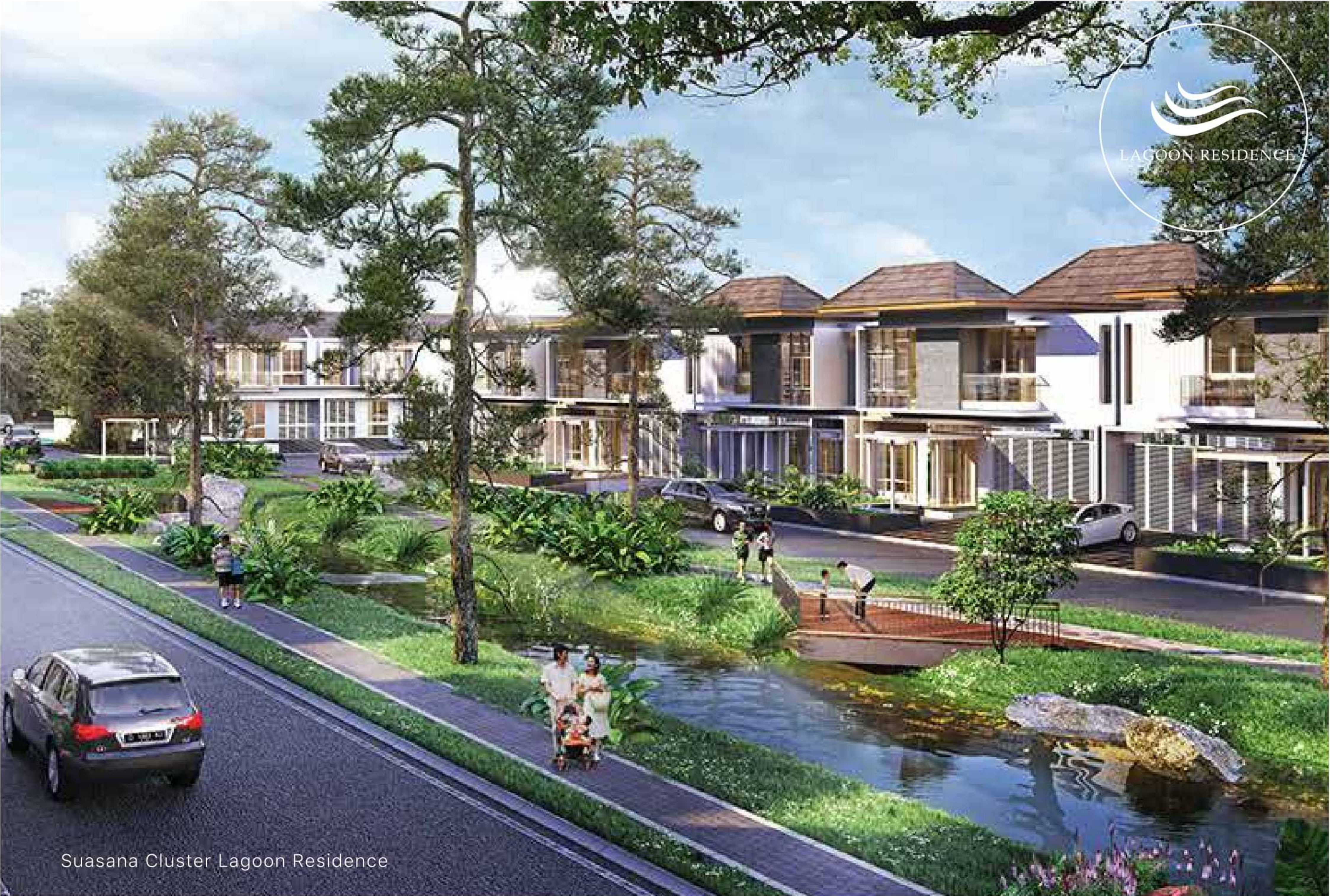
Suasana Cluster Lagoon Residence