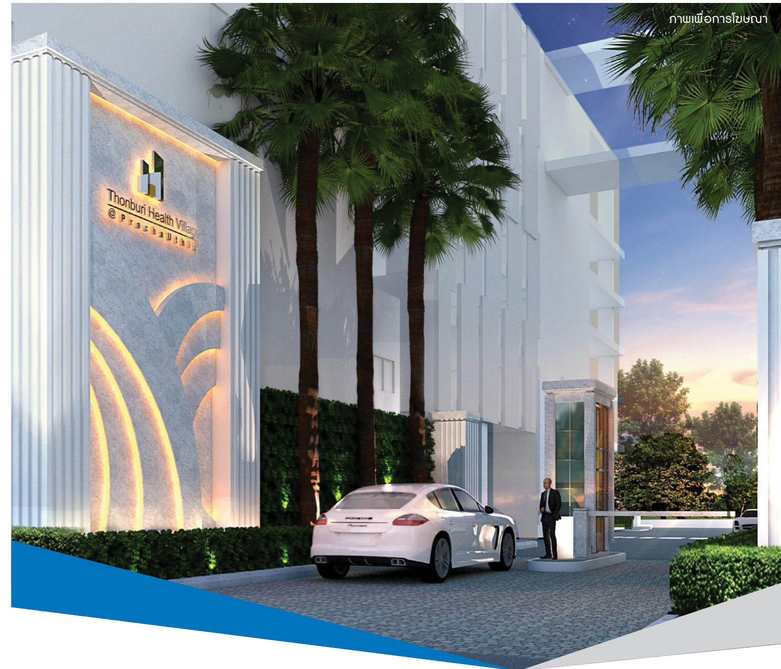
ภาพเพื่อการโฆษณา

เพียง 10 นาทีจากจุดขึ้นลงทางด่วนสุขสวัสดิ์ห่างจากสถานีรถไฟฟ้าประชาอุทิศเพียง 5 กม. (รถไฟฟ้าสายสีม่วงเตาปูน - ครุฑ) สะดวกสบาย เข้าออกได้หลายเส้นทาง ถนนสุขสวัสดิ์ ถนนพระราม 2 ถนนพุทธบูชา และรายล้อมด้วยสิ่งอำนวยความสะดวกครบถ้วน ใกล้มหาวิทยาลัย พระจอมเกล้าธนบุรี (บางมด) สวนธนบุรีรมย์ ศูนย์ฝึกกีฬาเฉลิมพระเกียรติ ๙๖ พรรษา ๖๐/๖๒ ตลาดใหม่