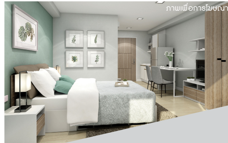
ภาพเพื่อการโฆษณา