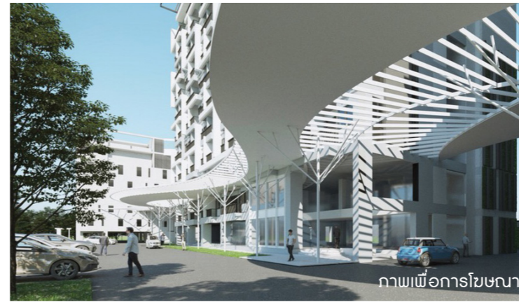
ภาพเพื่อการโฆษณา