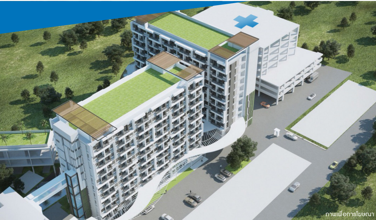
ภาพเพื่อการโฆษณา