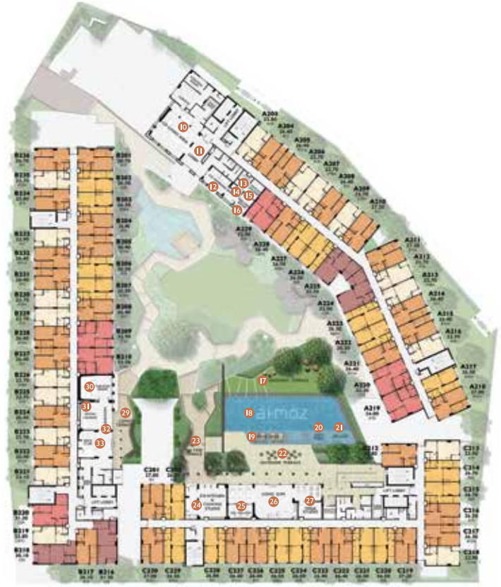
2 nd FLOOR PLAN