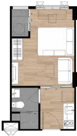
1 BEDROOM 22.70-23.90 SQ.M.