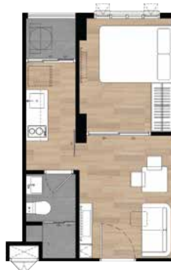
1 BEDROOM EXCLUSIVE 25.80-27.20 SQ.M.(B2)