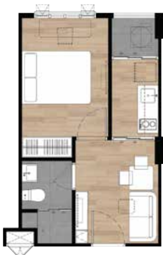
1 BEDROOM EXCLUSIVE 25.80-27.20 SQ.M.(B1)