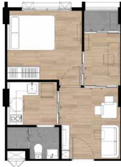
1 BEDROOM PLUS 31.20-34.00 SQ.M.