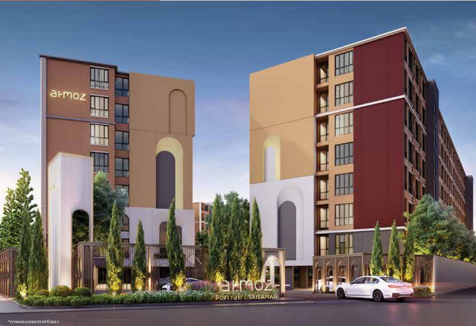
*ภาพและบรรยากาศจำลอง