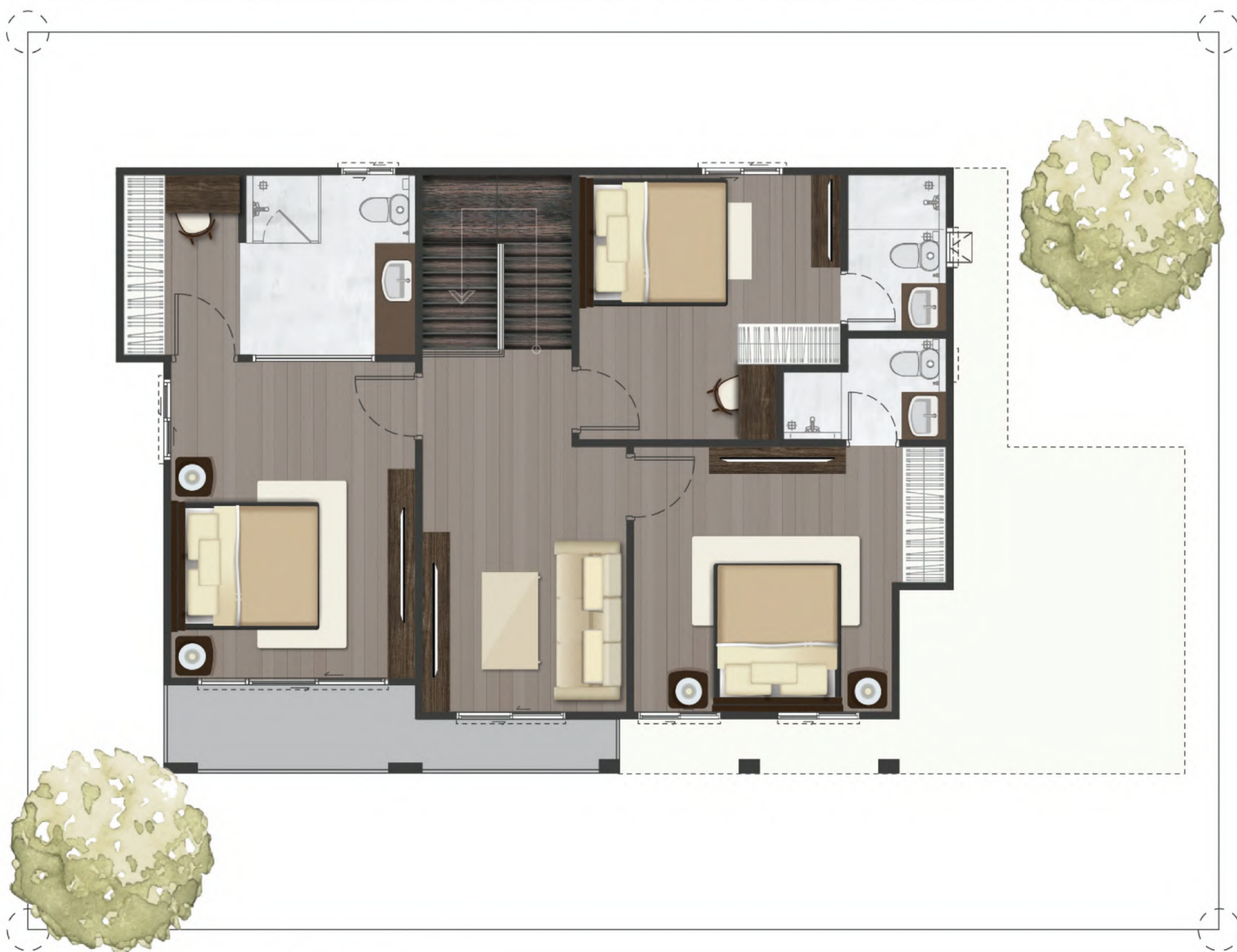
SECOND FLOOR PLAN