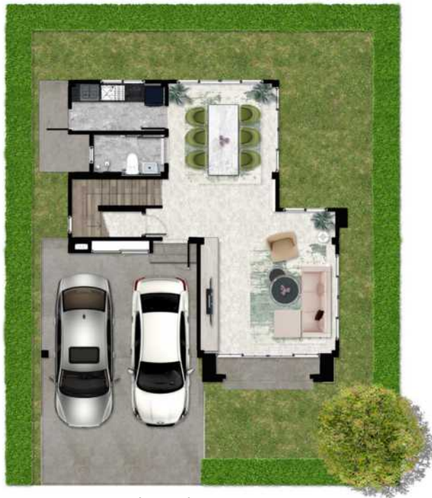
1 st Floor Plan