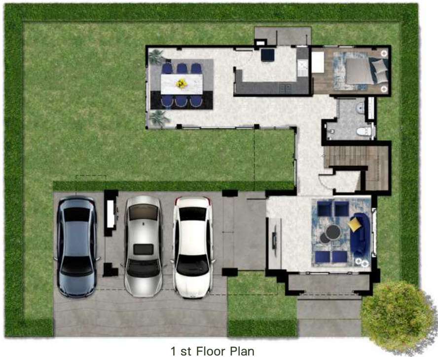
1 st Floor Plan