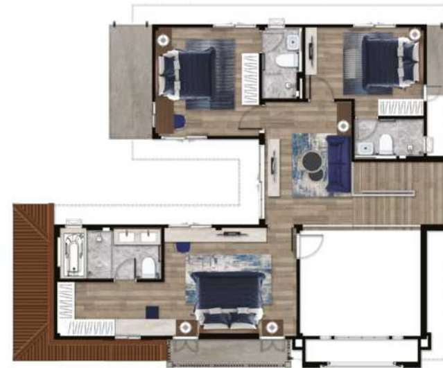
2 nd Floor Plan