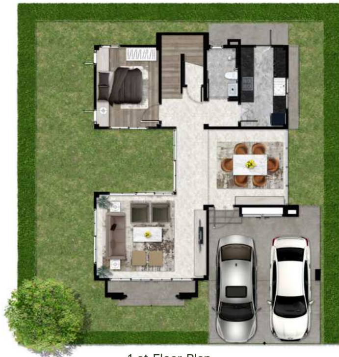
1 st Floor Plan