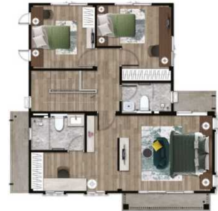
2 nd Floor Plan