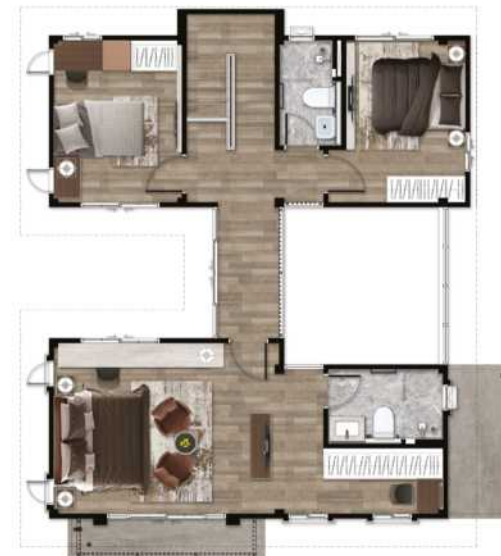
2 nd Floor Plan