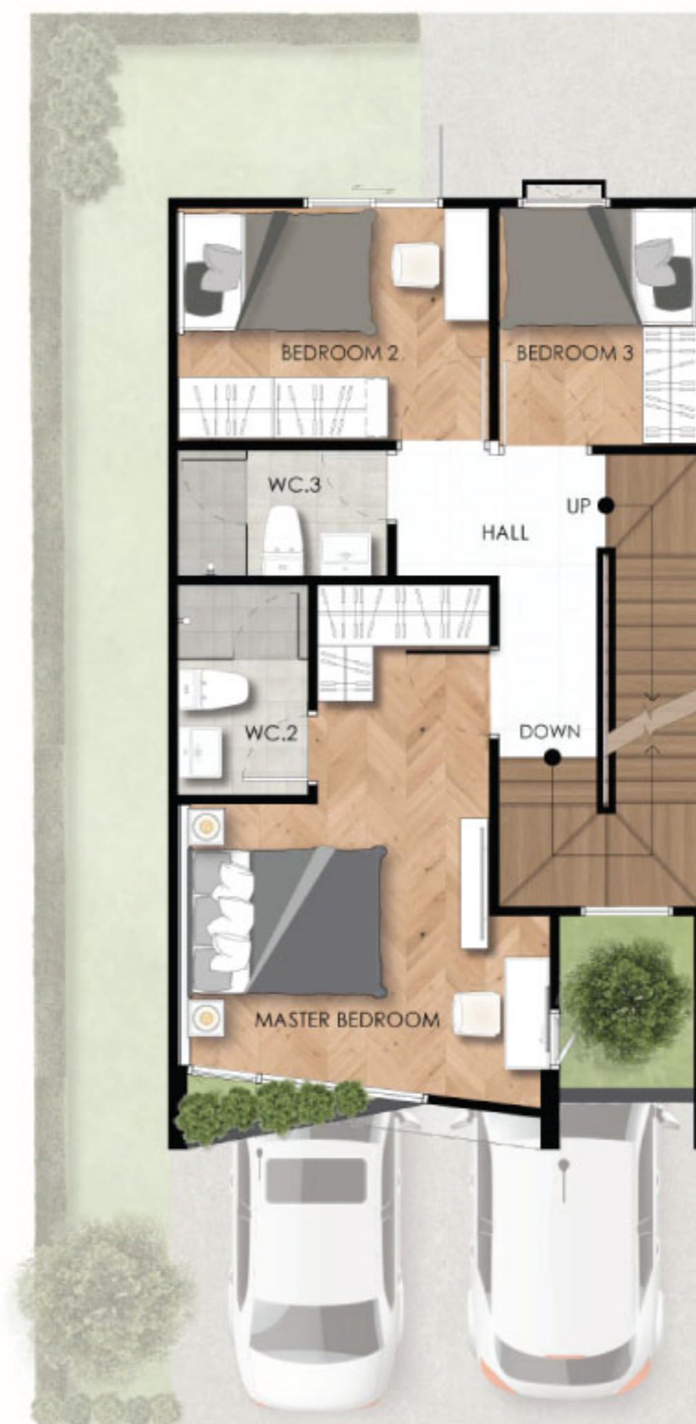
2nd Floor Plan