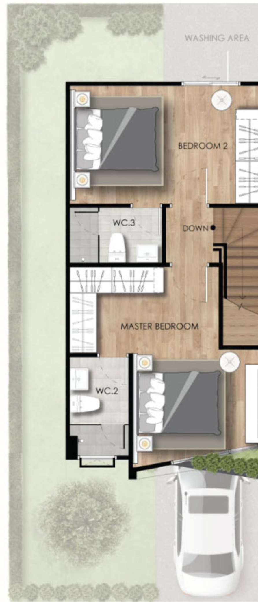
2nd Floor Plan

หมายเหตุ : คู่มือเฉพาะในแต่ละรายเป็นรายละเอียดของแปลน และ แบบบ้านนี้เพื่อเป็นแนวทางการพิจารณา สามารถดูรายละเอียดของบ้านหลังจริงในโครงการหรือดูของจริงได้ที่โครงการในเปลี่ยนรายการวัสดุและรายละเอียดอื่นโดยไม่ต้องแจ้งให้ทราบล่วงหน้า