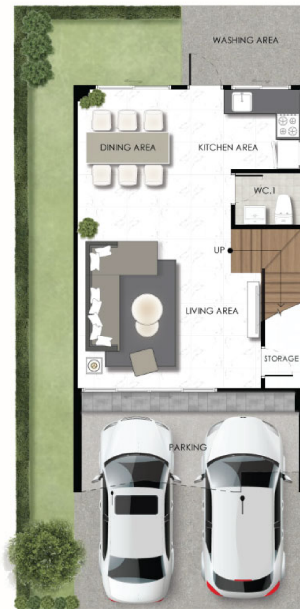
1st Floor Plan