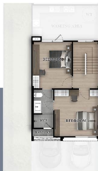
3 rd Floor