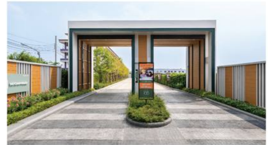
ภาพถ่ายใช้เพื่องานโฆษณาเท่านั้น