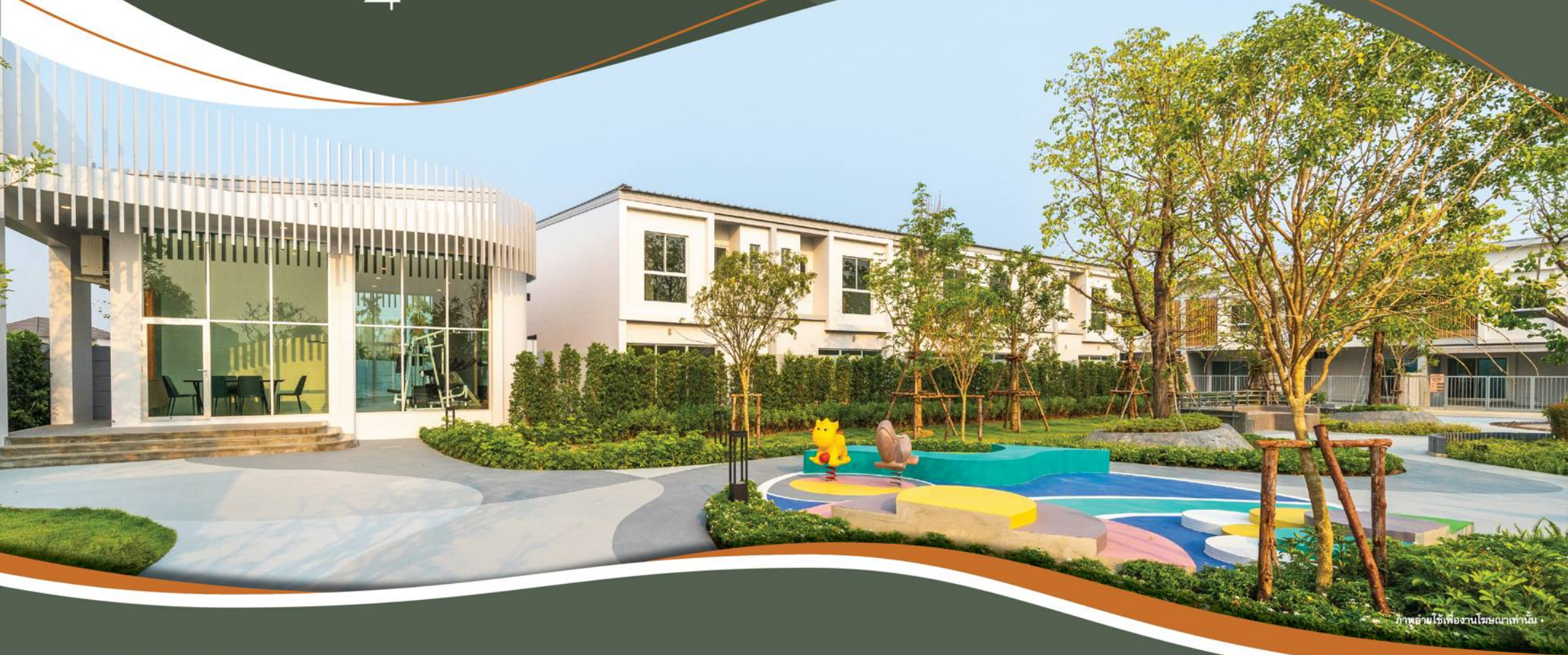
ภาพถ่ายใช้เพื่องานโฆษณาเท่านั้น