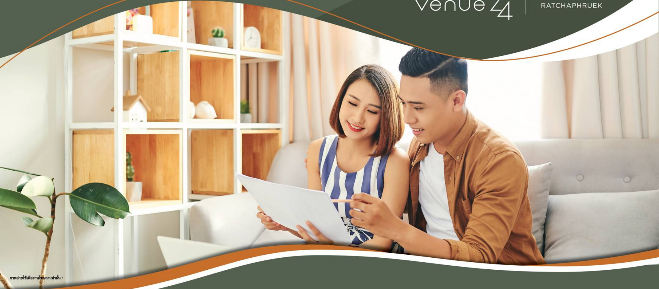
ภาพถ่ายใช้เพื่องานโฆษณาเท่านั้น