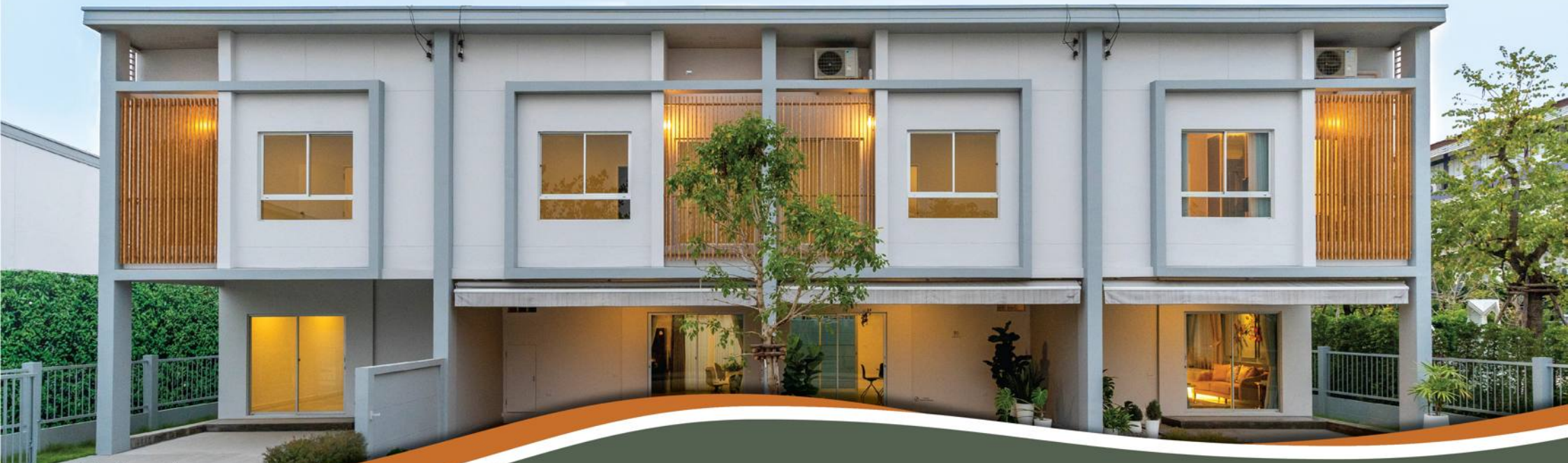
ภาพถ่ายใช้เพื่องานโฆษณาเท่านั้น