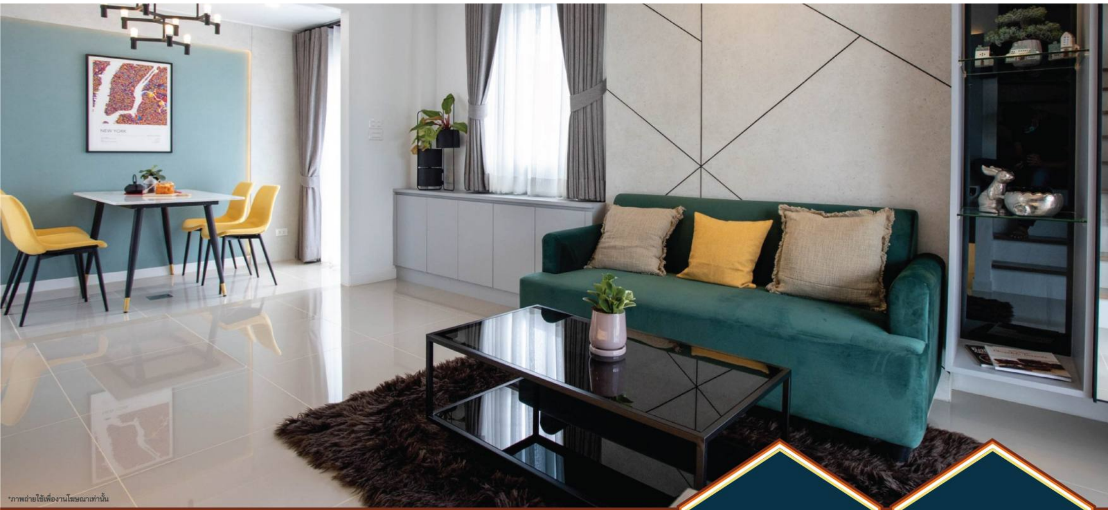
*ภาพถ่ายใช้เพื่องานโฆษณาเท่านั้น