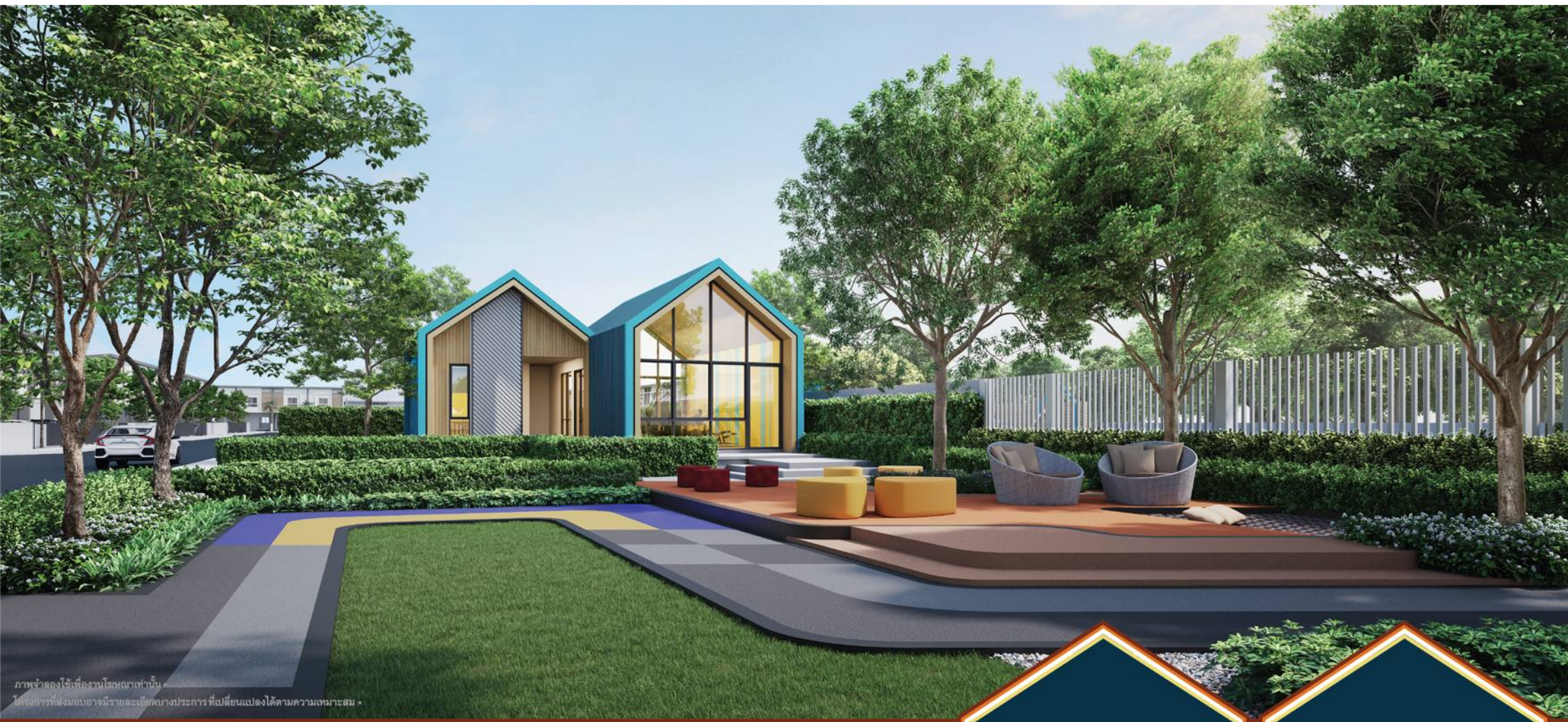
ภาพจำลองใช้เพื่องานโดยนิตยสารเท่านั้น โครงการที่ส่งมอบอาจมีรายละเอียดบางประการ ที่เปลี่ยนแปลงได้ตามความเหมาะสม