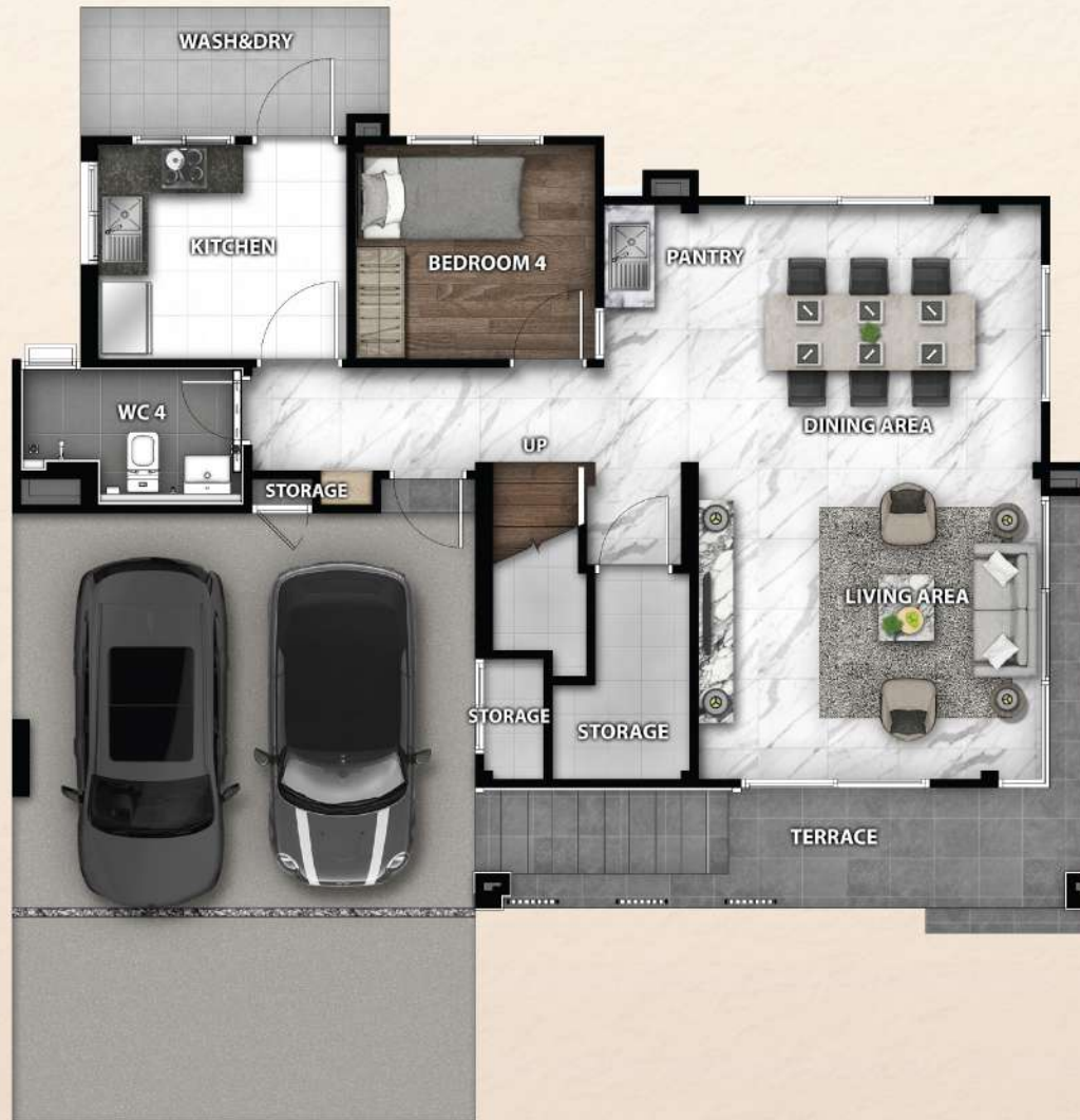
1 ST FLOOR PLAN