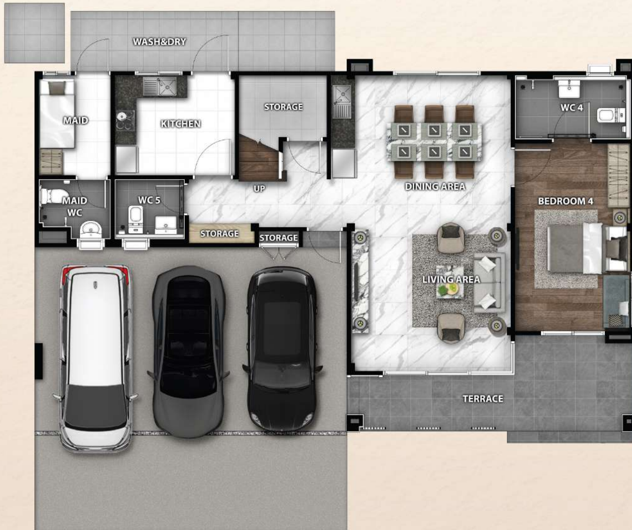
1 ST FLOOR PLAN