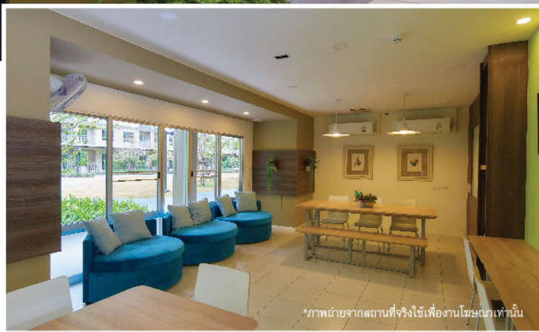
*ภาพถ่ายจากสถานที่จริงใช้เพื่องานโฆษณาเท่านั้น