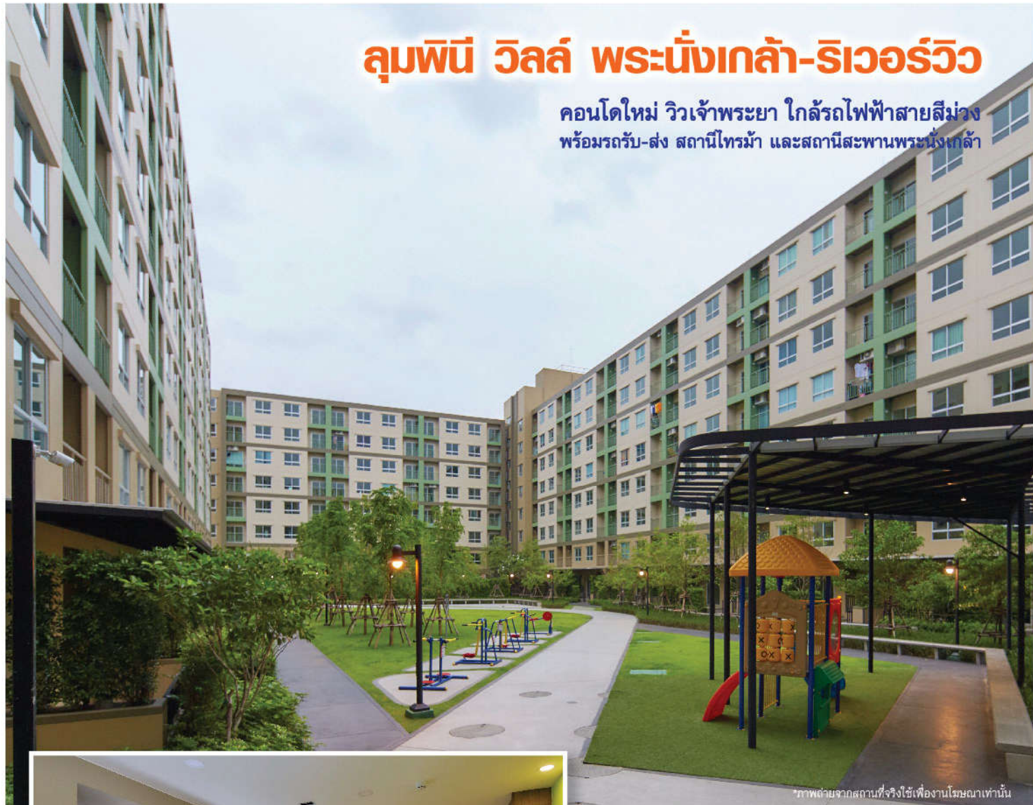
*ภาพถ่ายจากสถานที่จริงใช้เพื่องานโฆษณาเท่านั้น

คอนโดใหม่ วิวเจ้าพระยา ใกล้รถไฟฟ้าสายสีม่วง พร้อมรถรับ-ส่ง สถานีไทรม้า และสถานีสะพานพระนั่งเกล้า