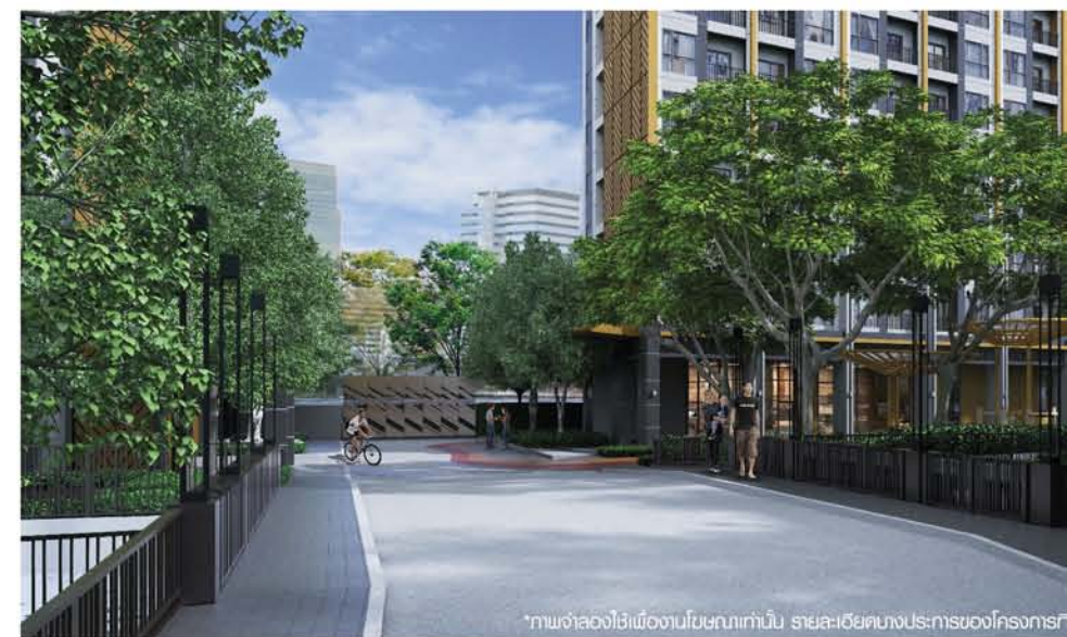
*ภาพจำลองใช้เพื่องานโฆษณาเท่านั้น รายละเอียดบางประการของโครงการที่ส่งมอบ อาจมีการเปลี่ยนแปลงตามความเหมาะสม

ความสำเร็จของทุกโครงการของ LPN ในย่านปิ่นเกล้า เป็นทั้งหลักประกันและแรงผลักดัน ว่าโครงการใหม่ๆ ที่เกิดขึ้น จะต้องดีงามไม่แพ้กัน ทั้งยังต้องแตกต่างอย่างโดดเด่น และ ลุมพินี พาร์ค บรมราชชนนี - ลีรินธร จะเป็นอีกบทพิสูจน์ ว่าชื่อของ LPN จะไม่ทำให้ผิดหวัง