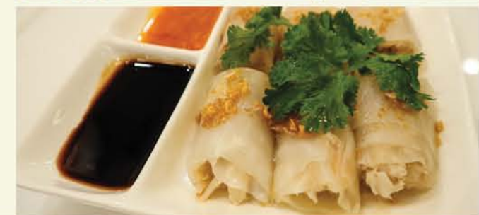
*ภาพประกอบทั้งหมดในเอกสารฉบับนี้ใช้เพียงองประกอบเท่านั้น