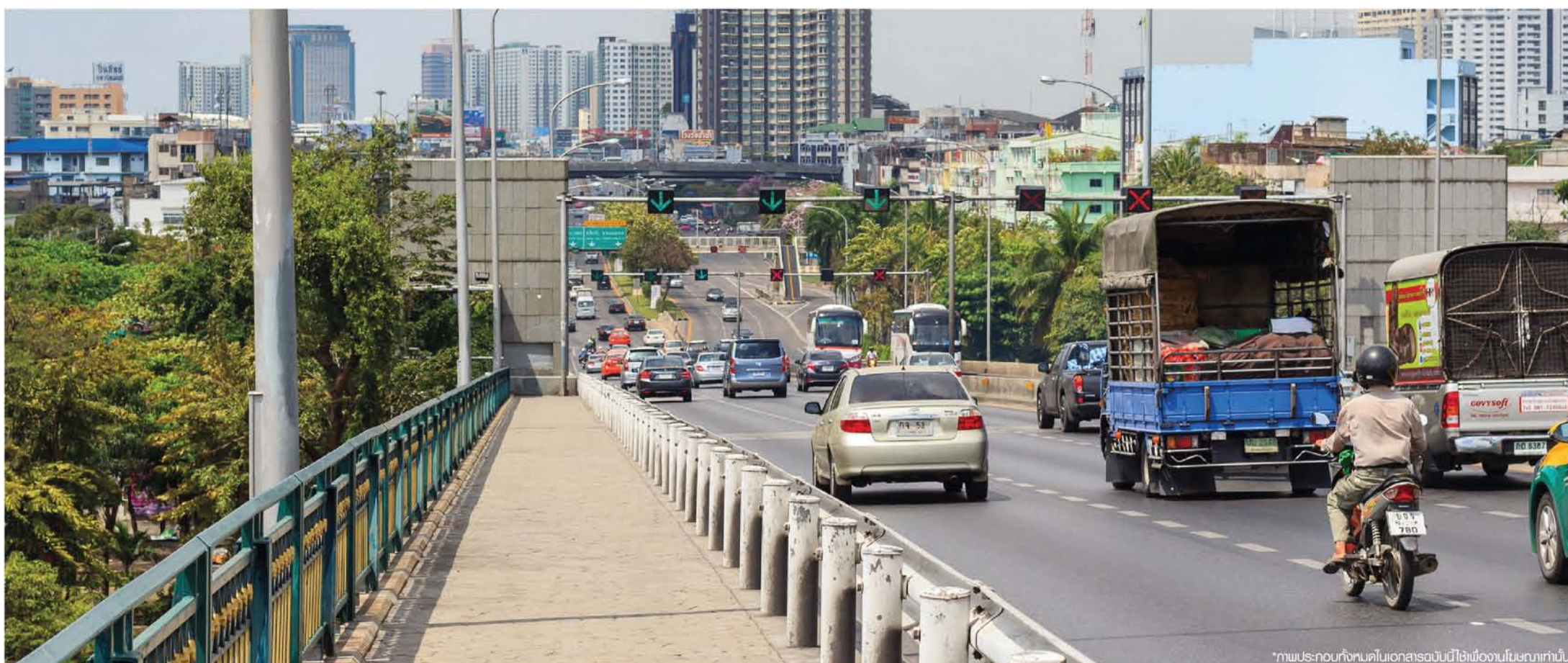
*ภาพประกอบทั้งหมดในเอกสารฉบับนี้ใช้เพียงนามสมมุติเท่านั้น