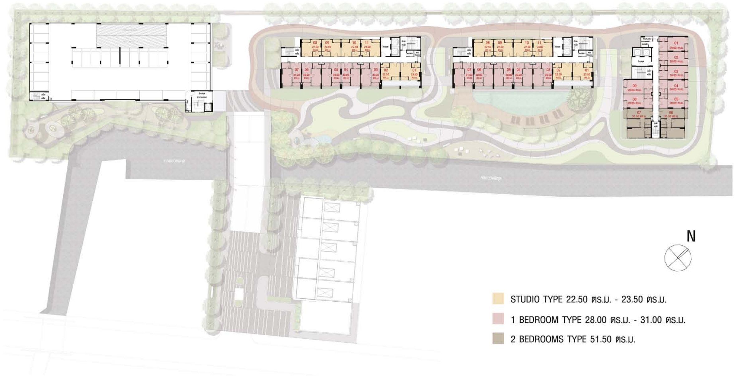
อาคาร C ผังพื้นที่ 2-24