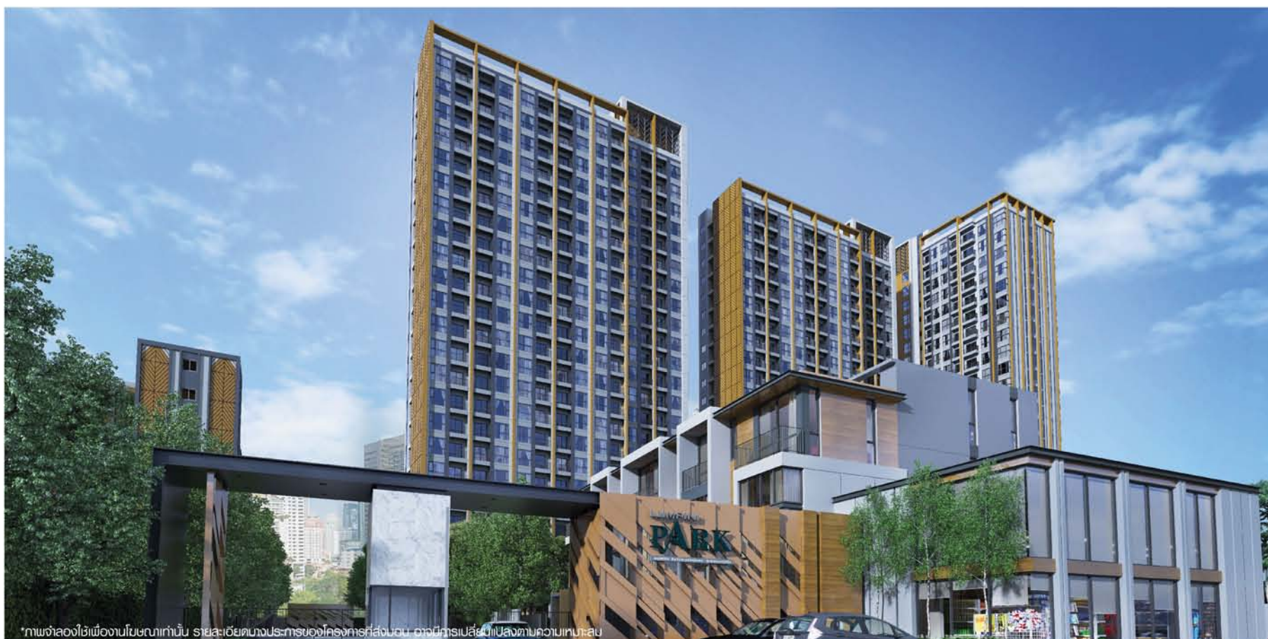
*ภาพจำลองใช้เพื่องานโฆษณาเท่านั้น รายละเอียดบางประการของโครงการที่ส่งมอบ อาจมีการเปลี่ยนแปลงตามความเหมาะสม