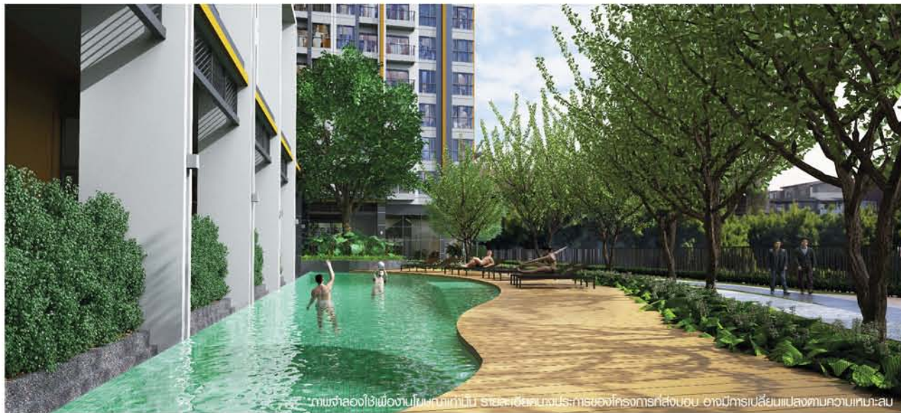
*ภาพจำลองใช้เพื่องานในขนาดเท่านั้น รายละเอียดทางประติมากรรมของโครงการที่ส่งมอบ อาจมีการเปลี่ยนแปลงตามความเหมาะสม