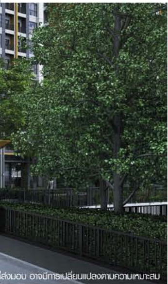
*ภาพจำลองใช้เพื่องานในขนาดเท่านั้น รายละเอียดทางประติมากรรมของโครงการที่ส่งมอบ อาจมีการเปลี่ยนแปลงตามความเหมาะสม