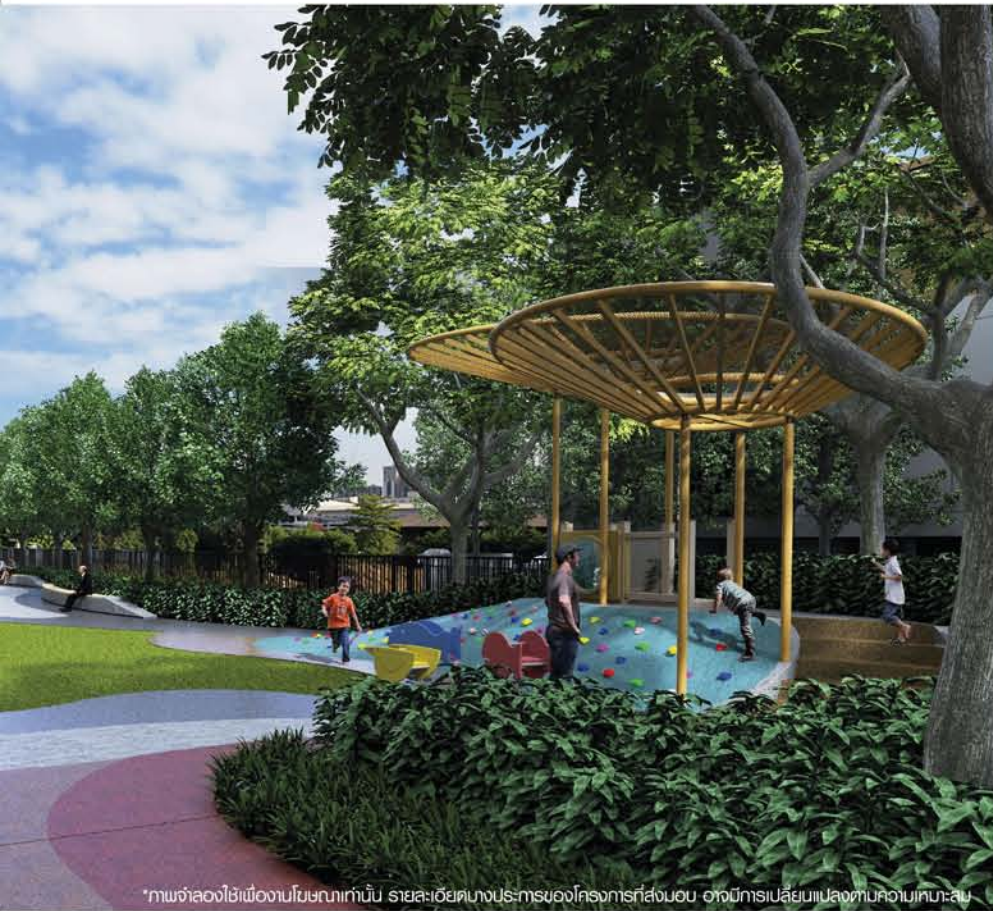
*ภาพจำลองใช้เพื่องานในขนาดเท่านั้น รายละเอียดทางประติมากรรมของโครงการที่ส่งมอบ อาจมีการเปลี่ยนแปลงตามความเหมาะสม