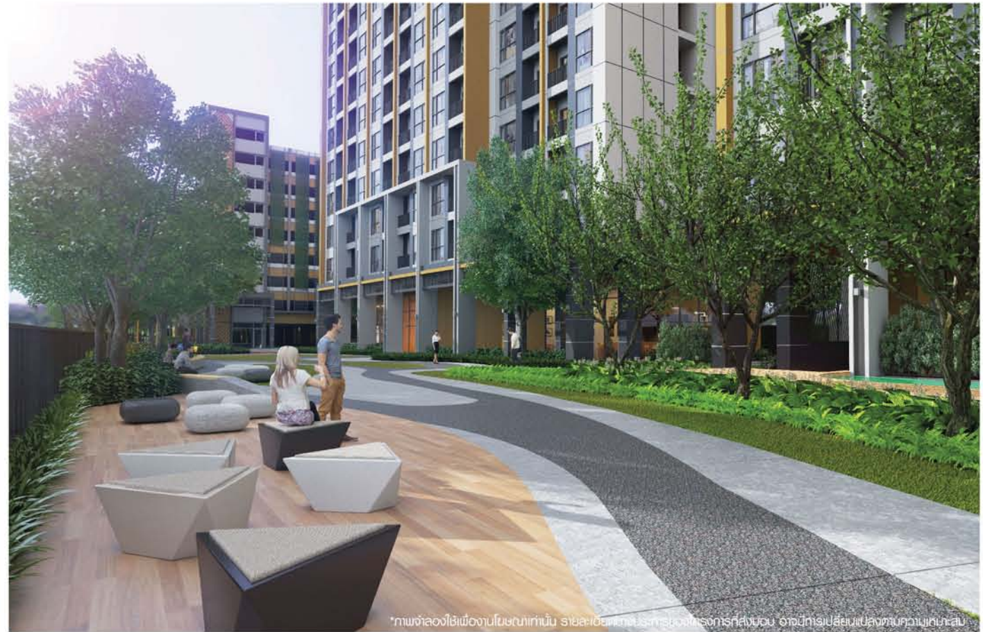
*ภาพจำลองใช้เพื่องานในขนาดเท่านั้น รายละเอียดทางประติมากรรมของโครงการที่ส่งมอบ อาจมีการเปลี่ยนแปลงตามความเหมาะสม